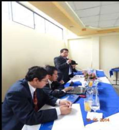
ALCALDES DE LA MANCOMUNIDAD DE TTTSV-T

SOCIALIZACIÓN DEL PLAN DE MOVILIDAD SUSTENTABLE EN ASAMBLEA ORDINARIA DE LA MANCOMUNIDAD (BAÑOS 30 DE MAYO 2014)