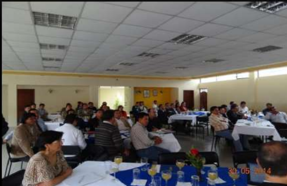
CONCEJALES DE LOS OCHO GAD MUNICIPALES